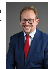
Tobias Bergmann Oberbürgermeister